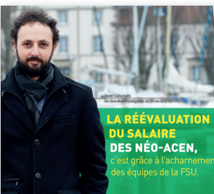
LA RÉÉVALUATION DU SALAIRE DES NÉO-ACEN,

c'est grâce à l'acharnement des équipes de la FSU.